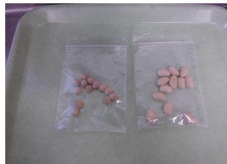
浸水前の大豆 と浸水後の大豆を比べてみました。

どんどん組さんと味噌を作りました。味噌は何から出来ているのか？という質問から、大豆のお話をしました。一晩かけて浸水した大豆と、浸水する前の大豆の大きさをみて驚いたり、大豆そのものも見る機会が少ないせいかとても新鮮だったようです。大豆をつぶす作業や麴を細かくする作業、どれも丁寧に取り組んでくれた「どんどん味噌」、完成が楽しみです！