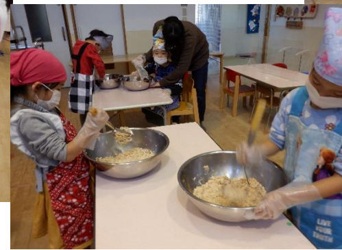
つぶした大豆に麴と塩を加え、さらに混ぜ合わせます。