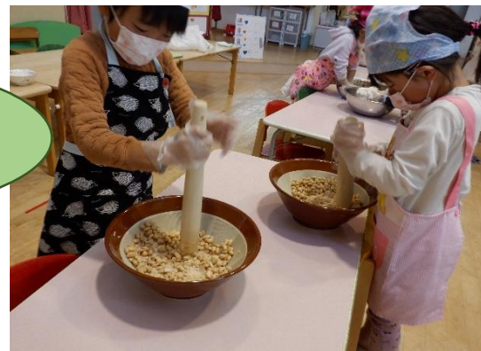
すり鉢とマッシャー、それぞれで大豆をつぶしました。