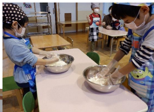
麴のかたまりをを細かくします。