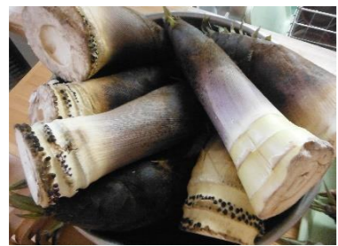
「筍ごはん」と「ふきの炒め煮」に入る筍！今から皮をむきます。

筍の美味しい季節になりました！どんどん組さんにお昼の給食の「筍ごはん」と「ふきと筍の炒め煮」に入る生筍の皮をむいてもらいました。「皮がたくさんある！」「どんどん小さくなるよ！」などの声上がり、筍の皮むきをとても楽しんでいる様子でした。大きかった筍が、皮をむくにつれどんどん小さくなっていく姿に興味深々でした。