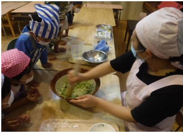
【子どもたちの前でずんだを作りました】

9月のおやつ「ずんだおはぎ」をどんどんさんが作りました。今回も自分の食べる分を自分で作りました。おはぎのごはんを自分で好きなかたちに丸め、その上に手作りずんだをのせました。まん丸や楕円、小さい丸を3個など自分好みのおはぎが出来上がり、ずんだが苦手な子も「食べてみるね！」と言って食べていました。