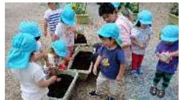
2歳児きらきら組もクラスでラディッシュの種を植えました。