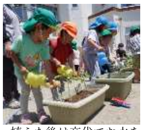
植えた後は交代でお水をあげました。