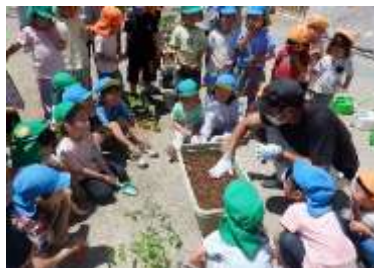
苗の植え方を教わりました。

先日3・4・5歳児が、JA仙台青年部のみなさんと夏野菜の苗を植えました。野菜の栽培を通して、食の大切さを感じられるようにしていきたいと思います。